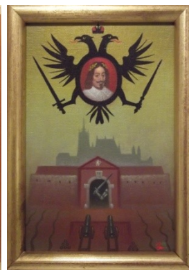
Praha 1648; Pražský malíř Norbert Grund; olej, dřevo